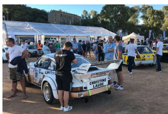
De nombreux passionnés dans le parc fermé de Porto-Vecchio.