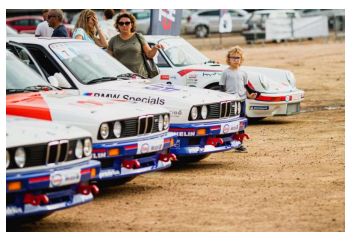
Les BMW M3 seront une vingtaine au départ.