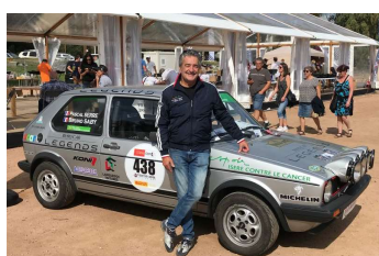
Ancien vainqueur du Tour de Corse WRC, Bruno Saby pilotera une VW Golf GTI.

La catégorie VHRS sera la première à s'élancer du parc fermé ce matin à 10h30 en direction de la spéciale ES1 - Muratello/Col de Bacino - longue de 11,039 km et dans laquelle le premier concurrent est attendu à 10h53. Suivra l'ES2 - Carbini/Levie - avec un premier départ à 11h21 pour un parcours de 7,029 km. Cette première journée se clôturera par l'ES3 - Gualdaricciu/Col de Pelza – (11,792 km) et le retour au parc fermé de Porto-Vecchio prévu à 16h00 pour les premiers équipages.