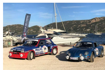
Deux icônes du Tour de Corse : R5 Turbo 2 et Alpine Berlinette.