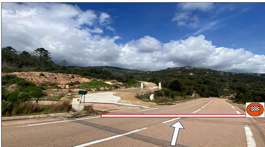
POINT STOP ES 17