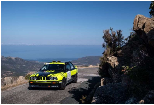
Christophe Vaison/Pascal Duffour (BMW M3).